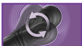
INTIMOTION & Vibration

4 POWERFUL MOTORS FOR THE ULTIMATE PLEASURE!