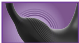
Vibrating Perineum Massager