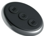
RECHARGEABLE REMOTE CONTROL