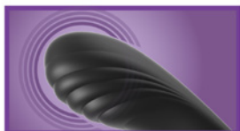
Textured, Vibrating Anal Plug